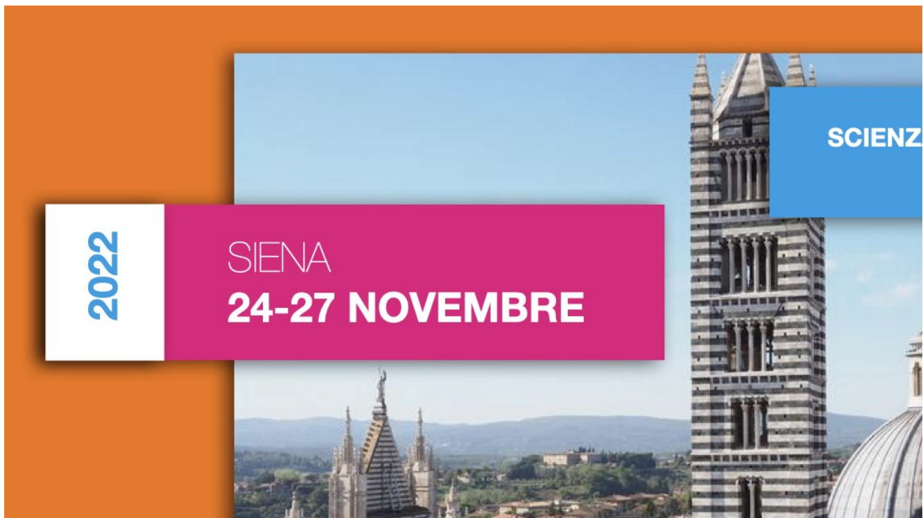
Festival della Salute Siena 24-27 novembre 2022

Oltre a questo, i giornalisti della testata online hanno preso parte attiva a dibattiti e tavole rotonde in qualità di moderatori.